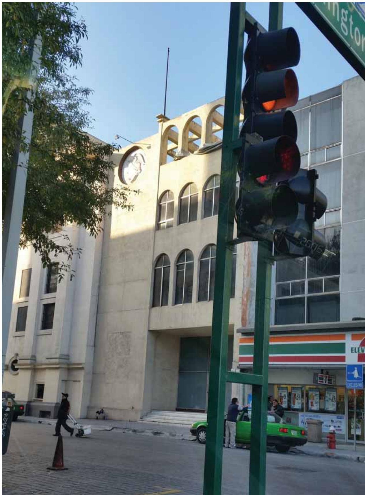
El antiguo edificio de la Sociedad de Viajantes en la actualidad.