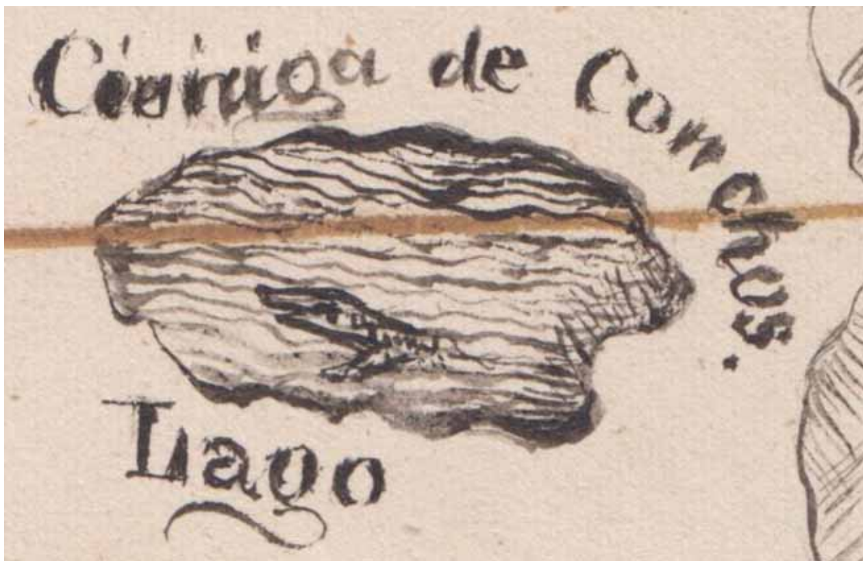
"Ciénega de Conchos con representación de un cocodrilo en sus aguas". Detalle del Mapa del partido de la ciudad de Linares del departamento de Nuevo León , "Papias Anguiano lo hizo", 1841.

de un sacerdote de nombre Ignacio en las aguas termales a fines del siglo XIX, 21 pero el nombre, como lo demuestra el mapa de Papias Anguiano, ya lo tenía desde 1841. Nuevamente en 1858 el depósito de agua es mencionado por Pedro José García al solicitar agua del río Conchos y las vertientes de la Ciénega de San Ygnacio , lo que se le concedió. 22