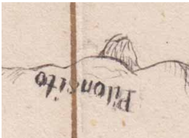
Piloncito. Detalle del mapa del partido de la ciudad de Linares del departamento de Nuevo León ; 6 de agosto de 1841, “Papias Anguiano lo hizo”.

La nota no carece de interés. En ella, Linares, como “cabecera de distrito” se supedita a Monterrey, ciudad “capital”. Desde el punto de vista nominal, los títulos que ostentan una y otra define su estatus en la geografía política de Nuevo León, Papias Anguiano estaba