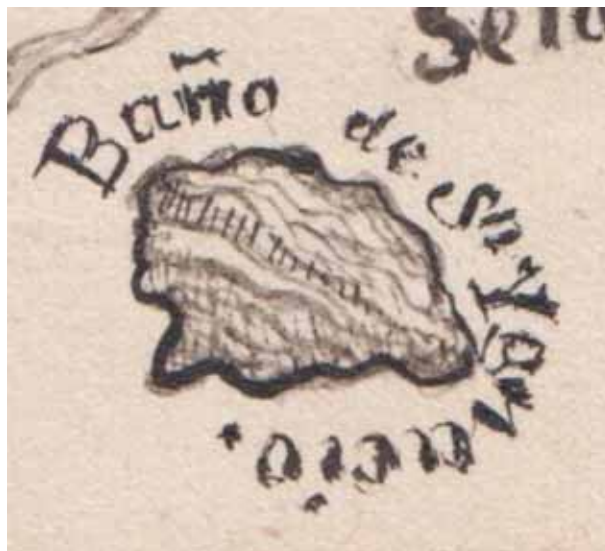
Depósito natural de agua "Baño de San Ignacio". Detalle del Mapa del partido de la ciudad de Linares del departamento de Nuevo León , "Papias Anguiano lo hizo", 1841.

Linares es, dentro de la concepción del mapa, punto del cual parten los ejes cardinales dividiéndolo en cuatro cuadrantes con tres subdivisiones radiales punteadas en cada uno.