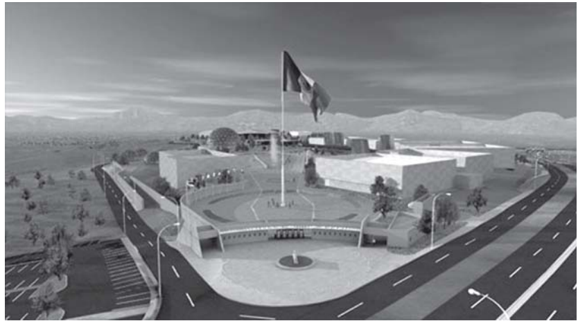
Imagen de la Expo Guanajuato Bicentenario en el municipio de Silao

G uanajuato.- Una de las obras más polémicas inaugurada el 17 de julio es la Expo Guanajuato Bicentenario en el municipio de Silao por su exorbitante costo de 1073 millones de pesos, por lo cual ha sido tachada por la oposición de negocio “muy turbio